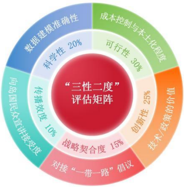
图 4 “三性二度”评估矩阵图

选取岛国核心议题，海平面上升、淡水短缺、气候移民等，使用NASA 海平面变化观测数据、太平洋共同体气候报告，跨学科组队，包括环境科学（气候模型构建）、国际政治（政策合规性分析）、旅游管理（韧性旅游开发）、语言学（本土知识采集），实行“1+1+1”导师制（校内导师+岛国合作导师+中资企业技术专家）。