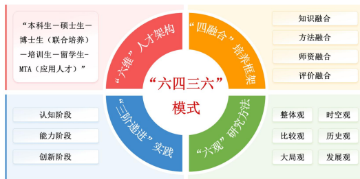
图1 “六四三六”模式结构图

太平洋岛国区域国别人才培养“六四三六”模式结构清晰、机制完善，具备较强的实践指导性和可操作性。具体内涵为：“六维”是指探索了国内首个“本科生－硕士生－博士生（联合培养）－培训生－留学生-MTA（应用人才）”为核心的六维人才架构。“四融合”是指以知识融合、方法融合、师资融合、评价融合为核心的“四维”培养框架。“三阶递进”是基于认知阶段、能力阶段、创新阶段的区域国别人才“三阶递进”实践体系。“六观”是指在前期学习和认知基础上，采用“整体观、时空观、比较观、历史观、大局观、发展观”综合研究方法论。这种区域国别人才培养模式以“深度区域知识”为根基，“全球视野与中国立场”为坐标，“跨学科能力”为工具，“文化同理心”为纽带，形成理论融合创新的人才培养闭环。