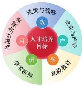
图5 “政产学研用”融汇图