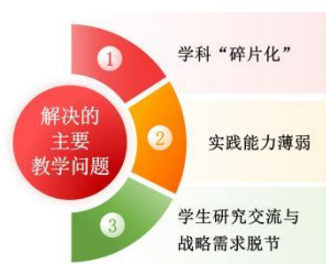
图 2 解决的主要问题示意图