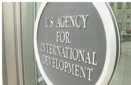
美国国际开发署总部

2月4日，梅西大学国防与安全中心学者指出，美国国际开发署（USAID）项目若遭削减，将严重影响太平洋地区的稳定与美国信誉。据悉，美国总统特朗普正考虑以“提升效率”为由大幅裁减美国国际开发署人员规模。作为全球最大援助机构，美国国际开发署每年向国际社会提供数十亿美元援助，其中约34亿美元（约合60亿新西兰元）用于太平洋地区。目前，太平洋岛国多依赖美国国际开发署支持推进公共卫生、环境治理及历史遗留问题解决，若资金断流，恐引发连锁发展危机。（来源：PINA）