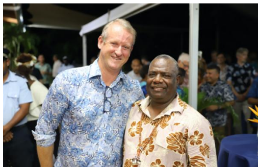
澳大利亚高级专员罗德·希尔顿（左） 与所罗门群岛副总理布拉德利（右）

2 月 16 日，澳大利亚驻所罗门群岛高级专员罗德·希尔顿（Rod Hilton）接待了所罗门群岛副总理布拉德利·托沃西亚（Bradley Tovosia）和其他政要，以巩固澳大利亚和所罗门群岛之间新一年的伙伴关系。希尔顿专员回顾了近年来两国间的大型合作互助项目，并称澳大利亚是所罗门群岛的头号安全伙伴，期待在 2025 年与所罗门群岛建立更加牢固的伙伴关系。（来源：Solomon Star）