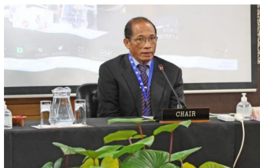
汤加新任土地和自然资源大臣法西

2 月 20 日，汤加新任教育和培训大臣兼土地和自然资源大臣法西（Fasi）在太平洋岛国论坛秘书处举办的深海矿产技术会议上，发表了关于深海采矿治理的重要讲话。他承认区域内对深海采矿潜力存在的不同看法，强调各国要协同合作，对深海采矿采取负责任的态度，《蓝色太平洋 2050 年战略》应成为讨论的基础。此次会议标志着太平洋岛国在探索深海矿产资源的同时，也致力于保护海洋环境，实现可持续发展。