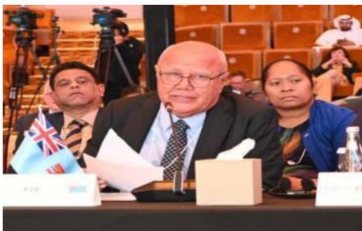
斐济副总理兼旅游与民航部长 维利亚姆·加沃卡

2月11日，斐济副总理兼旅游和民航部长维利亚姆·加沃卡（Viliame Gavoka）出席了在阿联酋阿布扎比举办的第四届国际民航组织（ICAO）全球实施支持研讨会。该研讨会主题为“为可持续未来而创新”，此次会议旨在提升全球民航的安全、安保和可持续发展。加沃卡部长参与了关于航空推动斐济经济和社会的小组讨论，并强调了建立安全、安保和可持续航空框架的重要性。此外，他还出席了首届全球可持续航空市场会议，支持航空业低碳，替代燃料的开发。