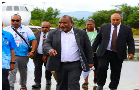
詹姆斯·马拉佩抵达霍尼亚拉