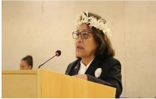
希尔达·海因发表演讲