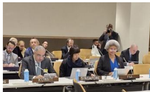
奎里奎里塔布阿讲话现场

9 月 27 日，外交部助理部长奎里奎里塔布阿（Lenora Qereqeretabua）出席第 79 届联合国大会高级别部长级会议，会议以“维护联合国宪章加强多边主义”为主题，从小岛屿国家的角度强调了国际和平与安全对可持续发展的重要性。奎里奎里塔布阿在讲话中表示，小国依靠多边体系来保障我们的安全和生存，“在我们共同应对共同利益和共同挑战的过程中，小国继续坚定不移地致力于基于规则的秩序及其所有价值观。”（来源：Government of Fiji）