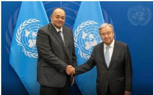
安东尼奥·古特雷斯与肖西·索瓦莱尼

奥·古特雷斯会见汤加首相兼太平洋复原力基金会外活动论坛主席肖西·索瓦莱尼 (Siaosi Sovaleni)。在会谈中，古特雷斯祝贺汤加成功主办了第53届太平洋岛国论坛领导人会议，并与索瓦莱尼讨论了关键的地区问题，包括早期预警系统和太平洋复原力基金。