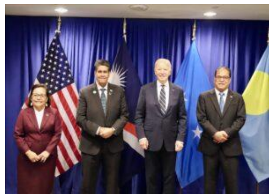
联合声明签署仪式现场

在9月24日至30日举办的第79届联合国大会期间，密克罗尼西亚联邦与美国、帕劳等国签署了一项重申《自由联系条约》的联合声明。密克罗尼西亚联邦外交部副部长里基·坎特罗（Ricky F. Cantero）出席了签署仪式。总统韦斯利·西米纳（Wesley W. Simina）在讲话中强调了《自由联系条约》对安全与稳定的重要意义。签署仪式后，西米纳总统在联合国会见了美国总统乔·拜登，双方围绕两国之间的伙伴关系与密切合作进行了进一步的讨论。