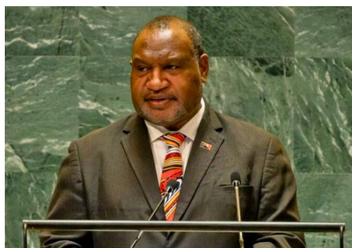
詹姆斯·马拉佩在联合国大会发言

9 月 28 日，巴新总理詹姆斯·马拉佩（James Marape）在联合国大会上发言，呼吁各国积极应对气候变化，并对太平洋岛国提供援助。马拉佩表示，巴新及其他太平洋岛国生态环境脆弱，而保护生态环境的花销对太平洋岛国来说负担沉重。此外，气候变化带来的诸如海平面上升等问题正威胁着太平洋岛国的人地安全。因此他呼吁各国对太平洋岛国伸出援手，提供尽可能的支持，共同应对气候变化。