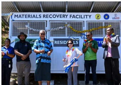
美国开发署工作人员与当地人员