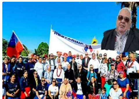
新西兰议会通过《西萨摩亚恢复公民身份修正案》

(Fakafanua) 为国会议员设定 14 天窗口期，以提名最高职位的候选人。第二天将再次召开议会，根据宪法第 50A 条完成遴选过程。在截止日期后的三天内，将由来自人民和贵族团体的民选代表开会推荐新首相。部分议员对过渡期间的领导层表示担忧。法卡法努阿勋爵表示，副总理将承担总理职责，直到继任者正式任职。（来源：PINA）