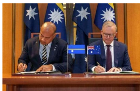
阿迪昂总理和阿尔巴尼斯总理

与图瓦卢签署的《邻里联盟条约》（Farapilli Union），确保澳大利亚无权干涉瑙鲁与第三国（如中国）签署的安全协议。瑙鲁政府突然转向中国，并签署“一带一路”合作协议，引发澳方担忧。此外，澳大利亚还计划通过让巴新于 2028 年加入国家钻井联盟（NRL），加强与太平洋岛国的关系。这一计划预计将耗资 6 亿澳元（约 3.86 亿美元）。