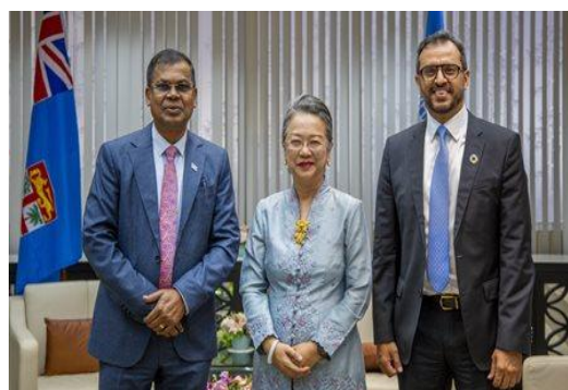
斐济副总理会见亚太经社会 执行秘书

国人口基金会合作，成立指导委员会以制定国家人口政策，就该政策的制定问题在苏瓦举行了为期两天的磋商，讨论涵盖了社会经济、环境和人口等多个方面。斐济政府一直大力倡导采用咨询和包容性的政策制定方式，本次斐济就制定国家人口政策展开咨询，表明该政策将能反映斐济人民的需求和愿望，也将在促进斐济未来经济发展方面发挥关键作用。