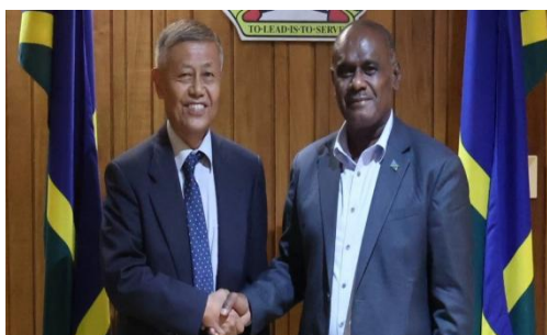
三和义明大使和马内莱总理