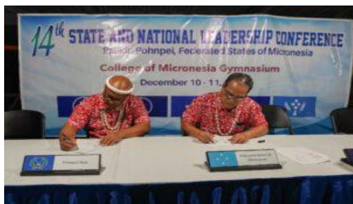
密联邦总统和州长签署承诺书现场

12月11日，密克罗尼西亚联邦（以下简称密联邦）总统韦斯利·西米纳（Wesley W. Simina）、波纳佩州州长史蒂文森·约瑟夫（Stevenson Joseph）和特德·威特（Ted Waitt）签署谅解备忘录，为波纳佩州支持密克罗尼西亚蓝色繁荣计划（Blue Prosperity Micronesia program）迈出了具有里程碑意义的一步。该协议强调了对海洋空间规划的共同承诺，推进密联邦的蓝色经济，加强可持续渔业，并保护该国专属经济区（EEZ）30%的共同承诺。