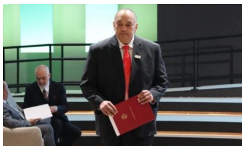
汤加首相于会议现场发表演讲

11 月 14 日，汤加表示强烈支持澳大利亚申办 2026 年第 31 届联合国气候变化大会。汤加首相胡阿卡瓦梅利库（Hu' akavameiliku）强调气候变化现在是并将继续是太平洋岛国面临的重大生存威胁这一事实。同时，作为太平洋岛国论坛的主席，首相胡阿卡瓦梅利库还提到“解锁蓝色太平洋繁荣倡议”，并希望太平洋复原力基金（PRF）能够为太平洋社区提供及时、可预测和扩大的气候融资渠道。