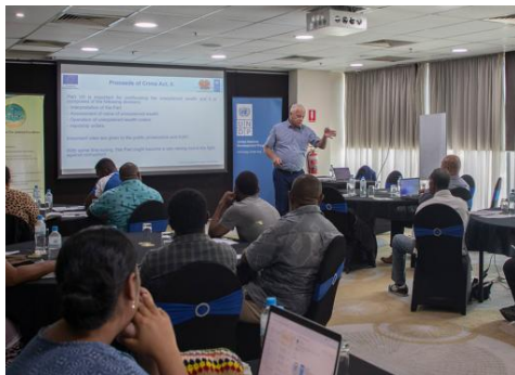
反腐败研讨会现场

11月7日，联合国开发计划署于巴新首都莫尔兹比港举办的反腐败研讨会顺利结束。此次会议旨在提升巴新反腐立法工作的效率并完善巴新反腐机构组织框架。开发计划署首席反腐技术顾问阿尔玛·赛德拉（Alma Sedlar）表示，司法系统在反腐斗争中具有至关重要的作用。本次研讨会力图将国际先进反腐经验引入巴新，推动巴新反腐工作的实施。（来源：Post Courier）