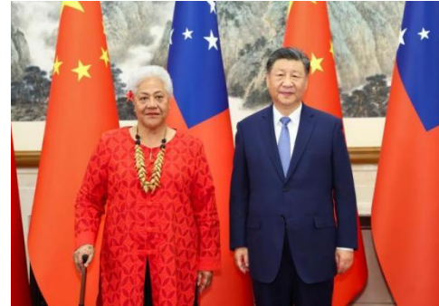
中国国家主席习近平会见萨摩亚总理

娅梅称萨方坚定恪守一个中国原则。菲娅梅也指出，萨方将中国作为重要战略伙伴，期待以明年共同庆祝两国建交 50 周年为契机，推动两国关系进一步发展。（来源：PINA）