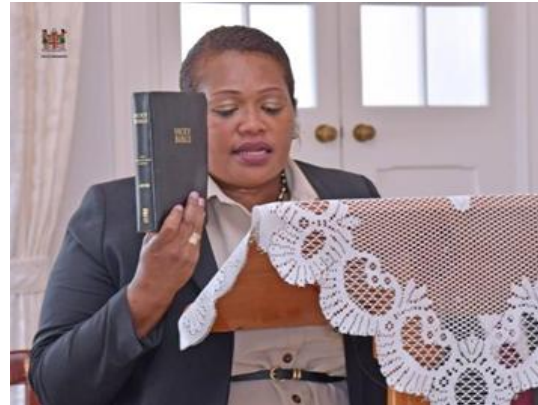
新任渔业和森林部长阿丽蒂亚·拜尼瓦