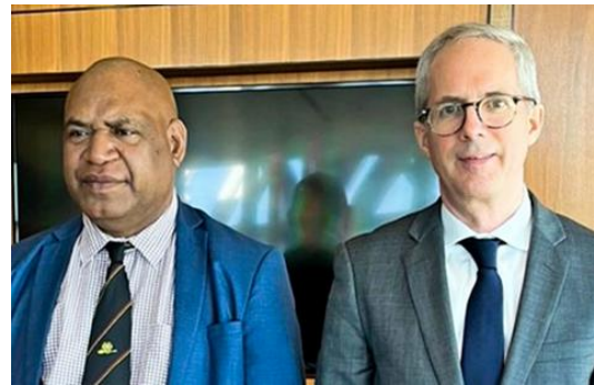
詹姆斯·马拉佩与斯科特·莫里斯

巴新，并与巴新总理詹姆斯·马拉佩等政府官员及民间代表举行会晤。会上，双方主要探讨了亚洲开发银行在巴新地区的战略重心及加强双方伙伴的相关举措。莫里斯表示，当前亚洲开发银行在巴新的援助项目侧重于基础设施，在未来还将加强对巴新公共卫生、普惠金融方面的投资。（来源：Post Courier）