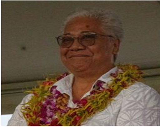
萨摩亚总理菲娅梅·内奥米·马塔阿法