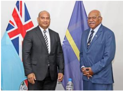
斐济总理兰布卡与瑙鲁总统阿迪