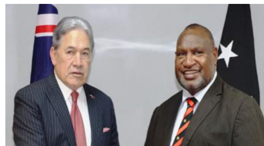
温斯顿·彼得斯与詹姆斯·马拉佩

5月13日，新西兰副总理兼外交部长温斯顿·彼得斯（Winston Peters）及随行人员抵达莫尔兹比港，开启其对巴新的访问。巴新总理詹姆斯·马拉佩（James Marape）对彼得斯的到访表示欢迎，并为其举行了盛大的欢迎仪式。之后，双方举行会晤，着重探讨了未来双方在国防、贸易投资、教育等方面的合作计划。