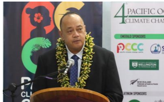
胡阿瓦梅利库总理正在发表讲话

萨摩亚首都阿皮亚举行。会上,首相胡阿瓦梅利库着重强调了金融在应对气候变化问题上的关键作用。其还表示,太平洋国家应拓展气候变化投资的来源,增强投资的灵活性。只有在充足而可靠的资金支持下,太平洋国家才能够将自身计划贯彻实行,并在此基础上合力应对气候变化。(来源:PINA)