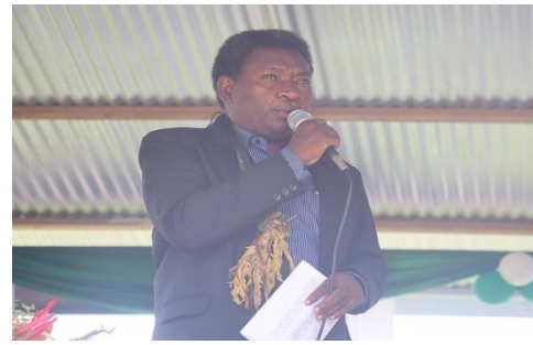
布干维尔自治政府副主席 帕特里克·尼西拉