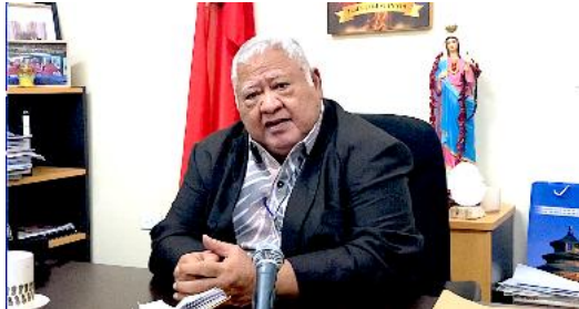
图伊拉埃帕谴责将萨摩亚技术工人排除在澳大利亚永久居留权的签证之外

澳大利亚重新考虑其政策。基里巴斯也面临类似签证限制，太平洋订婚签证政策引发广泛争议。