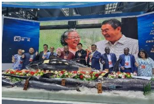
拉乌利等人参会影像

5月20日，萨摩亚农业和渔业部部长拉乌利·拉乌泰·波拉泰瓦奥·施密特（Laaulialemalietoa Leuatea Polataivao Schmidt）一行赴深圳参加国际渔业博览会，与中方代表就渔业发展深入交流。会议强调萨摩亚渔业发展潜力，探讨建设渔港和加工设施，预期此举将强化渔业合作，促进经济繁荣。此次访问为双方合作提供了新契机，预计这个拟议的渔港将通过加强渔业和吸引其他企业到该地区来促进萨摩亚的经济。