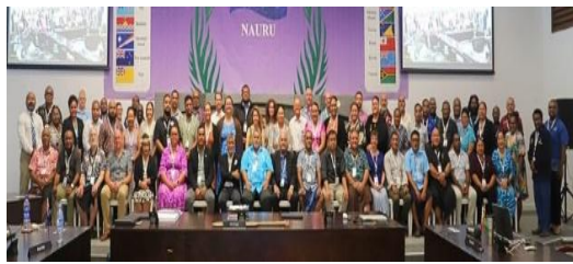
论坛渔业委员会参会人员合影

委员会（FFC）第 133 届官员年会在瑙鲁闭幕，会议由太平洋岛屿论坛渔业局（FFA）17 个成员国及区域国际组织参与。会议审议了金枪鱼渔业发展策略，批准了多项重要计划和战略，包括信息管理、性别平等、社会包容和气候变化应对策略，旨在加强数据系统、促进区域协调，并应对气候对渔业带来的挑战。同时，会议还探讨了东新不列颠倡议（ENBi）进展、区域监测与控制战略（RMCSS）及渔船劳工标准等问题，为金枪鱼渔业的可持续发展奠定了坚实基础。下一届论坛渔业委员会官员年会将于 2025 年 5 月在纽埃举行。（来源：PINA）