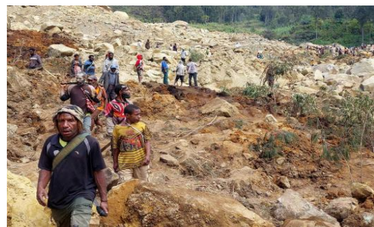
巴新恩加省滑坡受灾地

5月24日, 因数周以来的持续强降雨, 巴新中部恩加省发生大规模山体滑坡。由于事发凌晨, 山下村庄的大部分居民在熟睡中被埋入泥石之下。且当地地处山区, 交通不便; 加之持续的降雨, 整个救援工作难以展开, 被埋者生存机会渺茫。至截稿时, 本次山体滑坡已导致2000人被埋, 预估死亡人数达670人, 是该国近年来最为严重的山体滑坡。