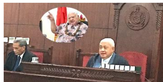
人权保护党负责人发声

5月17日，萨摩亚政府人权保护党（HRPP）领导人图伊拉埃帕·萨伊莱莱·马利埃莱额奥伊（Tuilaepa Sailele Malielegaoi）在演讲中对司法和法院行政部首席执行官2024年4月23日致萨摩亚法律协会（SLS）的信函副本中未说明恢复旧法院结构原因的言论表示震惊。他强调，由于公众对土地和业权问题持续不满，人权保护党开始推动法院结构改革。图伊拉埃帕批评当前信仰统一党试图恢复旧制的行为，称这是浪费公共资金，并指出土地和产权法院对于萨摩亚人土地和马泰所有权的重要性，及其决定的“物权”性质。他呼吁政府应坚持改善人民生活和保护他们权利的价值观，避免将重要议题政治化。（来源：Newsline Samoa）