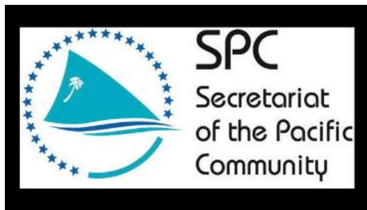
太平洋共同体标识

复原力建设。此次会议彰显了太平洋岛屿国家面对全球环境挑战的共同愿景和努力。