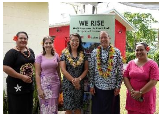
参加启动仪式的代表

（WE RISE）项目，旨在提高斐济、汤加和萨摩亚脆弱社区的气候适应力。该项目由美国国际开发署（USAID）出资150万美元，由天主教救济服务（CRS）与当地组织合作实施，将增加当地家庭获取安全的饮水和良好卫生设施的机会，并增强地方组织应对灾害的能力。基于美国对太平洋岛国灾害应对的长期支持，与各国的国家实际情况保持一致，此次项目的启动是美国为萨摩亚等地区提供人道主义援助的又一重要里程碑。