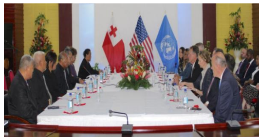
汤加副首相与美国联合国国会代表团会晤现场

4月24日，汤加副首相萨米乌·库伊塔·瓦伊普卢（Samiu Kuita Vaipulu）与美国的联合国基金会国会代表团举行双边会晤，旨在探讨联合国如何帮助小岛屿发展中国家应对新出现的挑战。双方讨论了包括气候变化和海洋在内的共同利益方面的合作；汤加主办的第 53 届太平洋岛国论坛领导人会议；5 月在安提瓜和巴布达举行的第四届小岛屿发展中国家会议；汤加与美国之间的双边外交关系。