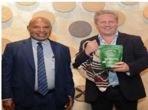
理查德·马鲁与托德·麦克雷

4月23日，巴新国际贸易和投资部部长理查德·马鲁 (Richard Maru) 于奥克兰与新西兰农业、渔猎、森林与贸易部长托德·麦克雷 (Todd McClay) 举行会谈。会上，马鲁对过去两国间缺乏交流表示了惋惜，并表示巴新愿效仿巴拉圭，同新西兰在农业、人员培养等方面开展合作；同时，巴新还希望同新西兰在投资领域达成共识，以此推动巴新经济特区的发展。马鲁还表示，巴新将努力推动两国关系的进一步深化，加强两国在更多领域的合作。（来源：Loop PNG）