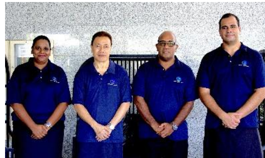
阿里伊奥艾加与论坛代表团

阿图法律改革专家等，并获太平洋岛国论坛秘书处支持。论坛秘书长亨利·普纳（Henry Puna）强调太平洋国家选举的独特性和民主价值。观察团将全程观察投票、计票，与多方会面，确保选举公正透明。选举共有334名候选人，其中20名为女性，42万余选民将参与投票。此次观察团行动符合《2000年比克塔瓦宣言》（Biketawa Declaration 2000）。