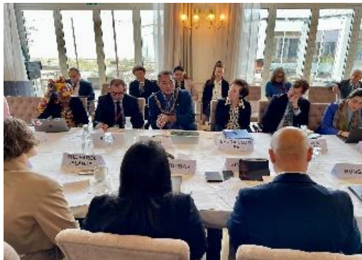
萨摩亚代表参加会议