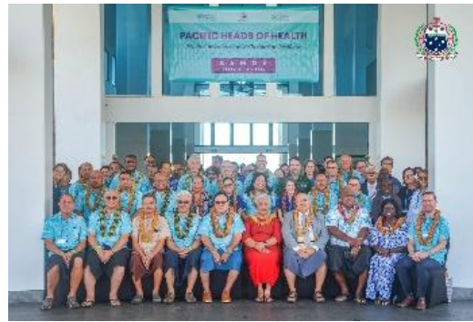
太平洋地区卫生首脑会议参会人员