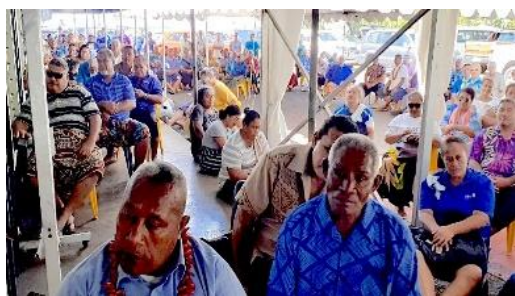
HRPP 信徒聚集在 Petesa 总部

4月25日，人权保护党（HRPP）的新西兰支持者将举行重要会面，与来访的反对党领导人共商大计。此次会面紧随对美属萨摩亚的访问之后，旨在加强与国际社区的联系。在奥克兰市的康得思酒店晚宴上，人权保护党领导人图伊拉埃帕·萨伊莱莱·马利埃莱额奥伊（Tuilaepa Sailele Malielegaoi）将与他的追随者和萨摩亚社区一起，澄清关于政府为侨民提供的各项政策与服务所存在的诸多误解和疑虑，他特别指出，海外萨摩亚人无需返国即可投票，并计划向新西兰议会特别委员会提交请愿书，要求废除1948年出台的萨摩亚《公民身份法》。目前，提交请愿书的计划正在紧锣密鼓地筹备中。（来源：Newsline Samoa）