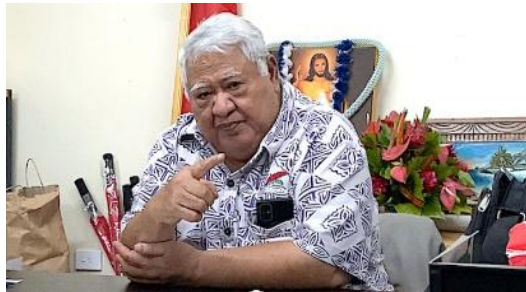
萨摩亚前总理图伊拉埃帕