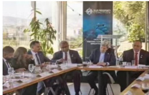
蓝色繁荣领导人圆桌会议现场

4月15日, 斐济常驻联合国代表菲利普·塔拉基尼基尼 (HE Flipo Tarakinikini) 参加了蓝色繁荣领导人圆桌会议 (the Blue Prosperity Leaders Roundtable), 共同商讨为保护和促进小岛屿发展中国家可持续发展所需的战略。各领导人经过讨论, 确立到2030年保护全球至少30%的海洋以及恢复沿海生态系统所需的战略。此次圆桌会议为志同道合的海洋领导人们提供了分享海洋保护、海洋空间规划、蓝色经济发展和可持续金融方面的成功经验和挑战的机会。