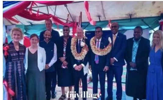
斐济和澳大利亚签署资金协议

医院基础设施总体规划。普拉萨德在签署仪式上表示，感谢澳大利亚政府在安全和国防、卫生、教育、气候变化、贸易和经济合作等领域对斐济的支持。（来源：Fijilive）