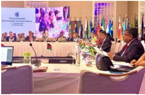
斐济在坦桑尼亚参加英联邦法律 部长会议