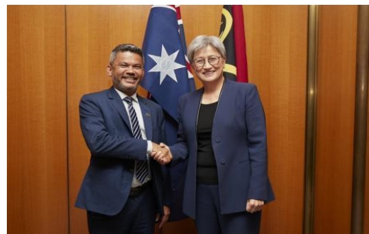
瓦努阿图副总理与澳大利亚外交部长

3月27日，瓦努阿图政府承认了澳大利亚和新西兰对瓦努阿图地区安全问题的担忧。瓦努阿图副总理马泰·塞里玛雅（Matai Seremaiah）3月26日在堪培拉受到澳大利亚外交部长黄英贤（Penny Wong）的接见。在会晤中，塞里玛雅副总理表达了对2022年12月双方签署的安全协议的担忧，同时，瓦努阿图也理解澳大利亚与新西兰在区域安全问题上的考虑。瓦努阿图感谢澳大利亚在经济贸易与安全救灾方面的支持，并希望双方能持续对话。黄英贤部长表示，两国有着持久的关系，瓦努阿图始终可以信赖澳大利亚，共同繁荣发展。（来源：PINA）