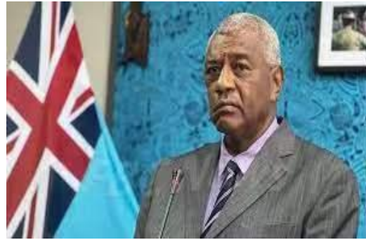
斐济内政部长 皮奥·蒂科杜阿杜阿演讲