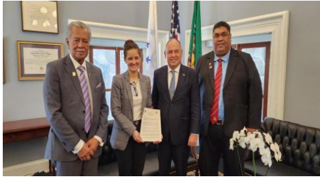
谅解备忘录签署现场