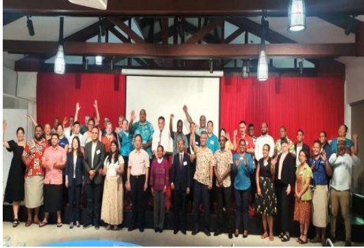
萨摩亚研讨会与会人员