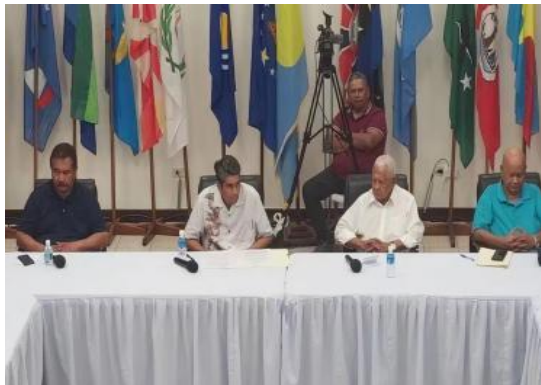
帕劳总统惠普斯宣布美国国会通过《条约审查协议》

向帕劳领导层介绍了美国国会成功通过《条约审查协议》（Compact Review Agreement）这一情况。此条约的通过，是两国关系的重要里程碑，也是惠普斯执政期间的一项显著成就。2024 年条约审查首席谈判代表帕劳财政部长卡莱布·乌杜伊卡莱布·乌杜（Kaleb Udui）表示，条约审查协议的资金是第一次报价的两倍，而且比到期日提前一年通过。（来源：PINA）