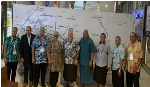
波利尼西亚地区领导人

网络安全、加强海上和空中的互联互通并大力发展教育事业。此外，会议就加强气候适应力、海洋和核遗产问题的国际参与和宣传及波利尼西亚国家的发展问题进行了讨论，重新审议了治理安排问题并确定在萨摩亚设立常设秘书处办事处。（来源：Govt of Tonga）