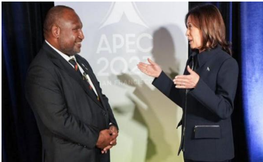
巴新总理马拉佩与美国副总统玛拉·哈里斯