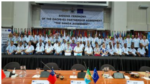
71 个非加太国家签署《萨摩亚协议》

11 月 16 日晚上，71 个国家认可并签署了《萨摩亚协定》，该协议将于 2024 年 1 月 1 日开始适用。此协议是接续《科托努协议》，并作为未来 20 年的法律框架。该协议旨在加强欧盟和非加太国家共同应对全球挑战的能力。新的《萨摩亚协议》将有助于更好地共同应对全球挑战，并将在未来二十年加强在贸易、气候、和平与安全等领域的合作。新的伙伴关系协议制定了共同原则，涵盖人权、民主与治理、和平与安全、人类与社会发展、包容性与可持续经济增长和发展、环境可持续性与气候变化以及移民和流动等优先事项。（来源：PINA）