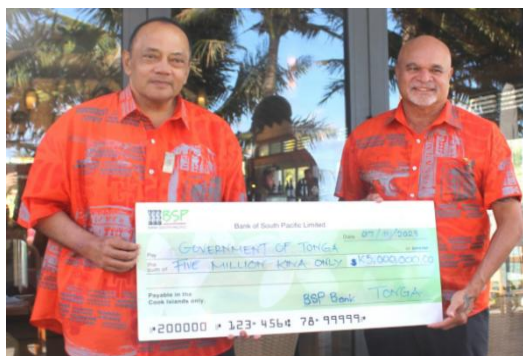
胡阿卡瓦梅利库和约翰·罗索

11月7日，汤加首相胡阿卡瓦梅利库（Hu' akavameiliku）在拉罗汤加岛接受了巴新副总理约翰·罗索（John Rosso）提供的500万基纳的经济援助，这有助于推动汤加从灾难中恢复。胡阿卡瓦梅利库表示，汤加和巴新有着牢固和密切的外交关系，希望双方加强经济、文化和人民之间的联系。