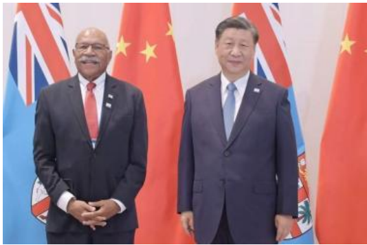
斐济总理与中国国家主席

11月17日，亚太经合组织第三十次领导人非正式会议期间，斐济总理兰布卡会见中国国家主席习近平。兰布卡称，斐济政府愿与中国开展合作，坚定支持中国的“一带一路”倡议、全球安全倡议，坚持一个中国原则。习近平表示，中方愿与斐济携手加强“一带一路”合作，落实全球发展倡议，推动基础设施、新能源等领域的合作，促进斐济经济社会发展。习近平向兰布卡发出访华邀请。