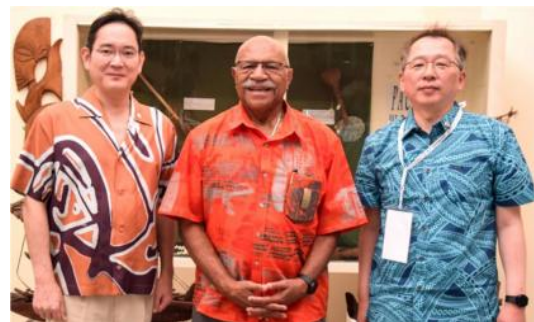
斐济总理与韩国海洋水产部长

11月9日，斐济总理兰布卡会见韩国海洋水产部长赵承焕 (Seung-hwan Cho)。双方讨论了在渔业和海洋领域的合作，庆祝双方签署建立渔业与海洋合作中心谅解备忘录。兰布卡对韩国国际合作机构 (KOICA) 对斐济社会发展的支持致以感谢，表示愿与韩国在卫生领域开展更广泛的合作，包括在专业医疗领域提供奖学金和为医务人员提供培训机会等。兰布卡称，小岛屿国家需要在超级大国的竞争中，维护自身利益。（来源：Fijilive）