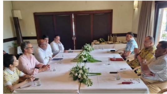
胡阿卡瓦梅利库与丹尼斯·弗朗西斯举行 双边会晤