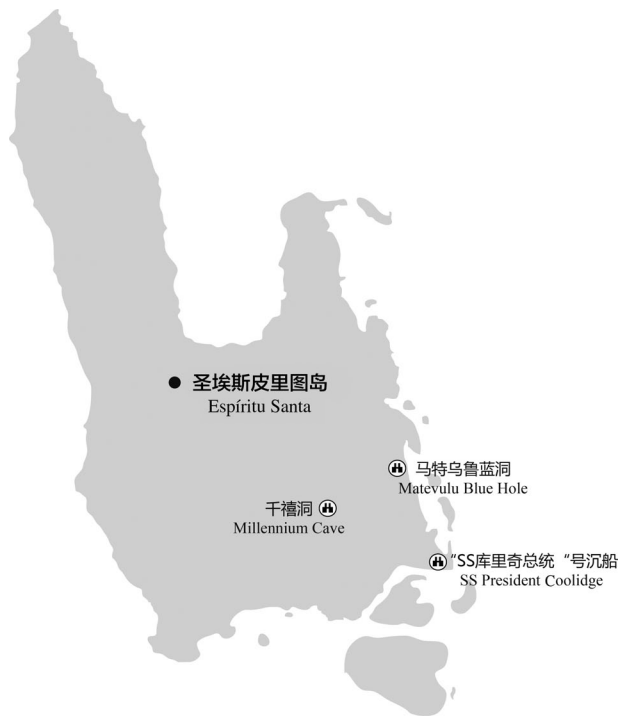
图 5-2 圣埃斯皮里图岛主要景点分布示意