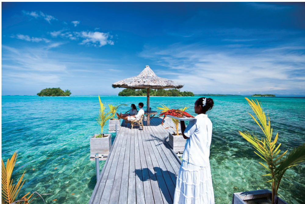
蜜月度假胜地