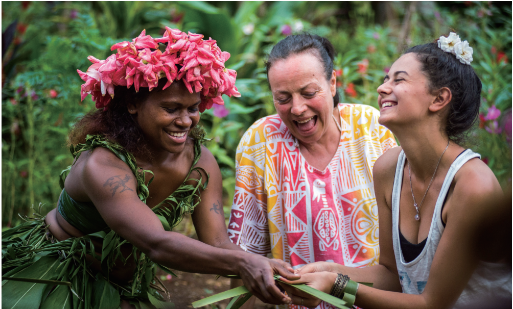
游客体验传统手工编织