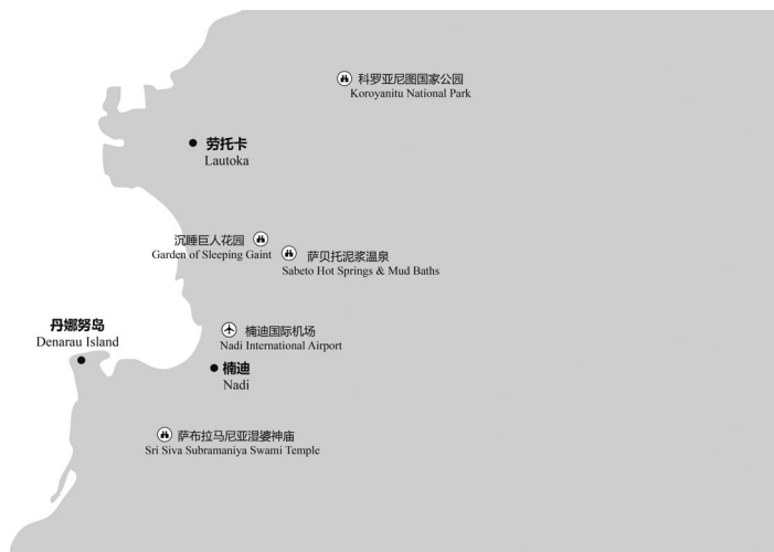
图 1-1 楠迪及其周围主要景点分布示意图