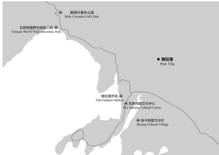
图 5-1 维拉港主要景点分布示意

博物馆（The National Museum of Vanuatu）、瓦努阿图历史文化遗址调研中心（The Vanuatu Cultural and Historical Site Survey）、国家图书馆（The National Library）等 10 个机构。瓦努阿图文化中心收藏了大量来自各岛屿的传统手工艺品，包括小型独木舟、雕塑等，并且有精彩的沙画表演和乐器演奏，是了解瓦努阿图历史和文化的的好地方。