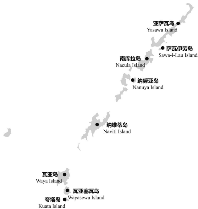
图 1-6 亚萨瓦群岛主要景点分布示意