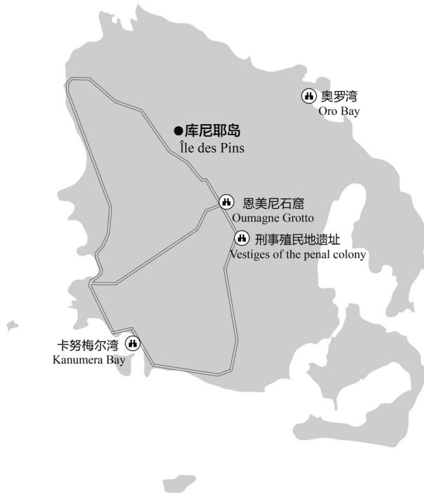
图 4-2 库尼耶岛主要景点分布示意

上是个十分重要的人物，她是第一个使用法语的美拉尼西亚人。1869 年，年轻的霍滕斯嫁给了海岛的未来首领塞穆尔·温德古 (Samuel Vendégou) 而成为皇后。相传进入石窟后，只要找到年轻皇后的石床并投掷一枚硬币就可以实现自己的心愿。需要注意的是，洞内比较潮湿，进洞时最好带着火炬并准备一双合适的鞋子。