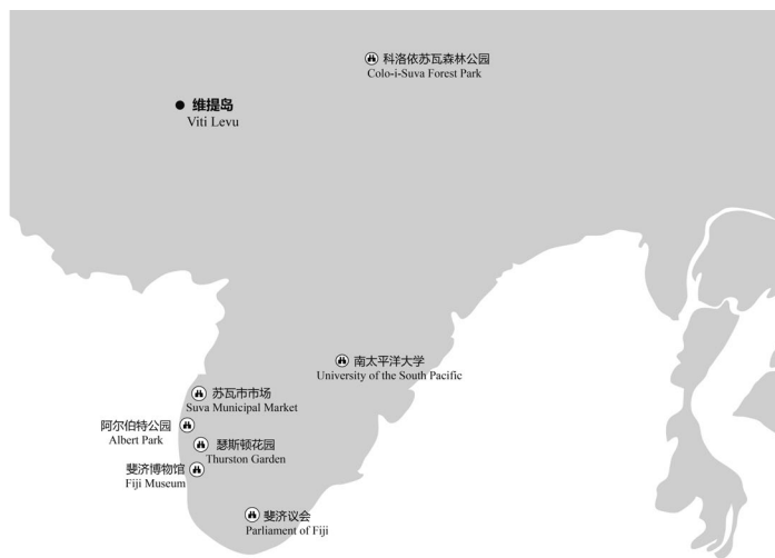
图 1-3 苏瓦主要景点分布示意

英国人征服斐济用的来复枪和牛皮封面《圣经》都可以在这里找到，其中还包括食人族使用的叉子、木棍、卡瓦碗、贝壳饰物以及其他有考古价值的手工制品。巨大的拉图·菲纳乌（Ratu Finau）是斐济最后一艘双壳体独木舟（waqa tabus），全长 13.43 米，位于博物馆的中心区域。在这个博物馆中，还保存有传教士托马斯·贝克的一只鞋。1867 年，托马斯·贝克在传教时由于自己一时大意从酋长头上夺回梳子惹怒了当地村民，而被村民杀死和吃掉。这只鞋因为煮不烂、咬不动而被留了下来，在这个博物馆中无声地讲述着这让人不寒而栗的食人悲剧。