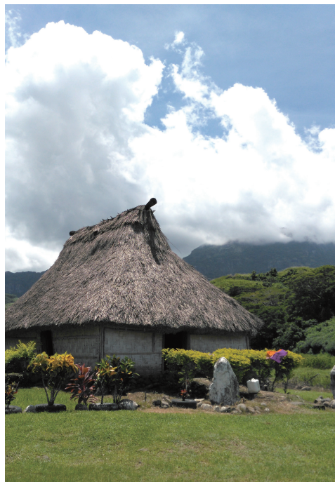
传统村落议事厅