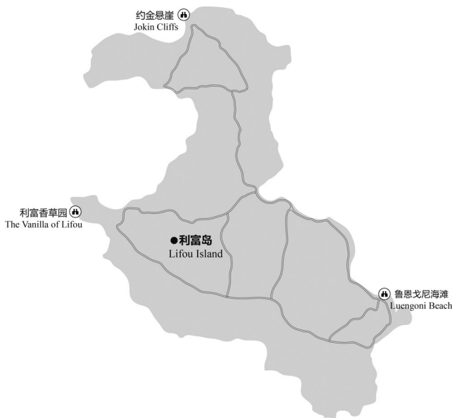
图 4-3 利富岛主要景点分布示意