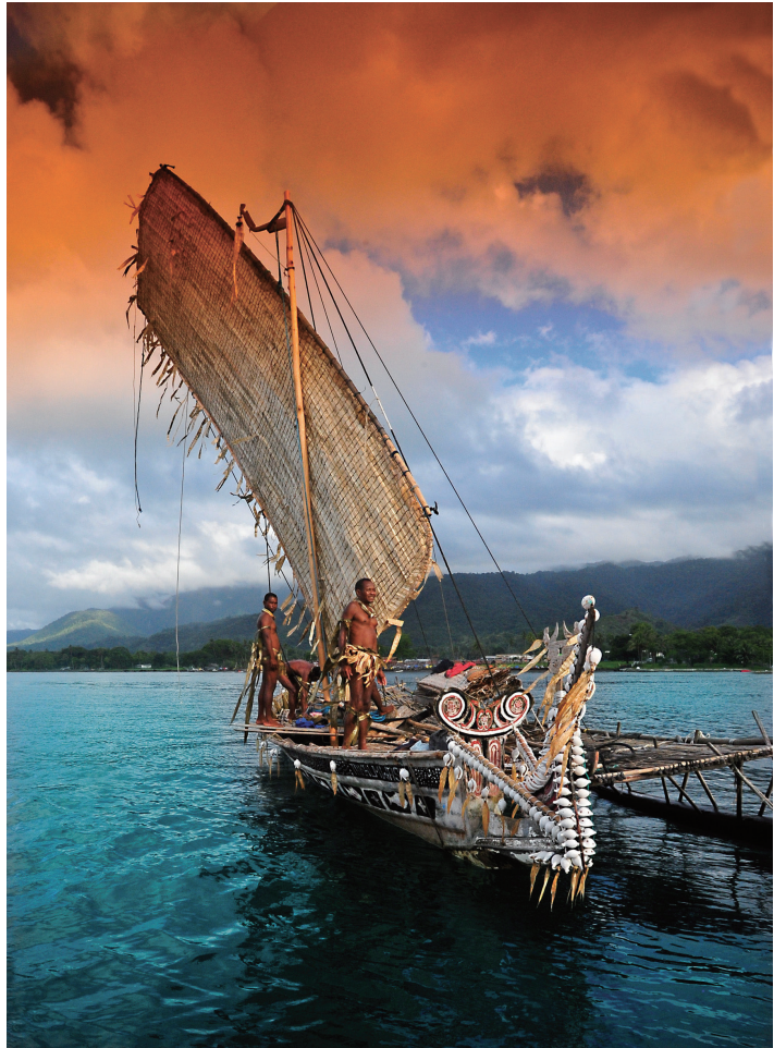
当地传统帆船