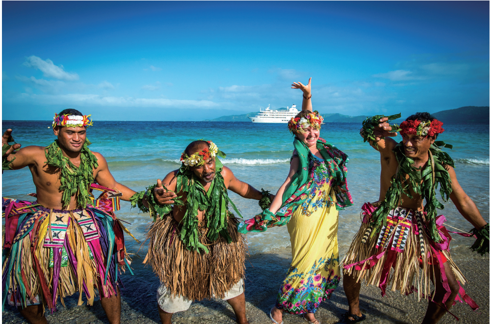
穿裙戴花的斐济男人