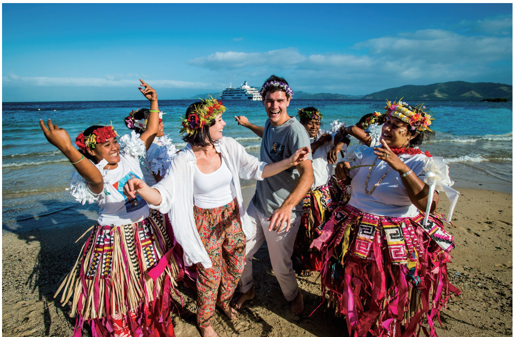
游客与土著居民共舞