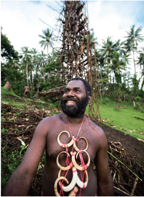
男子佩戴象征财富的猪獠牙