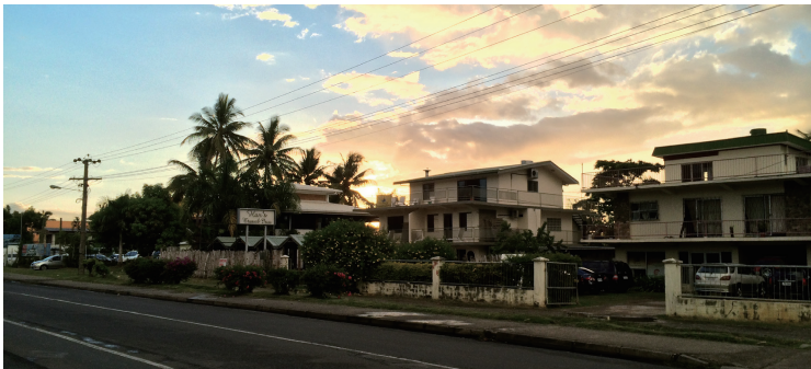
楠迪主干道