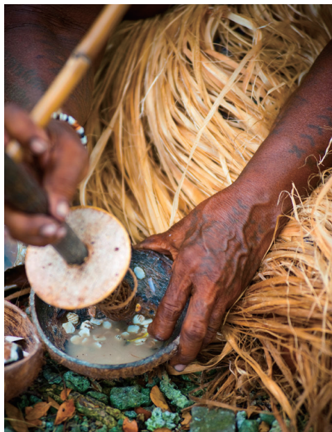
土著妇女正在制作传统食物