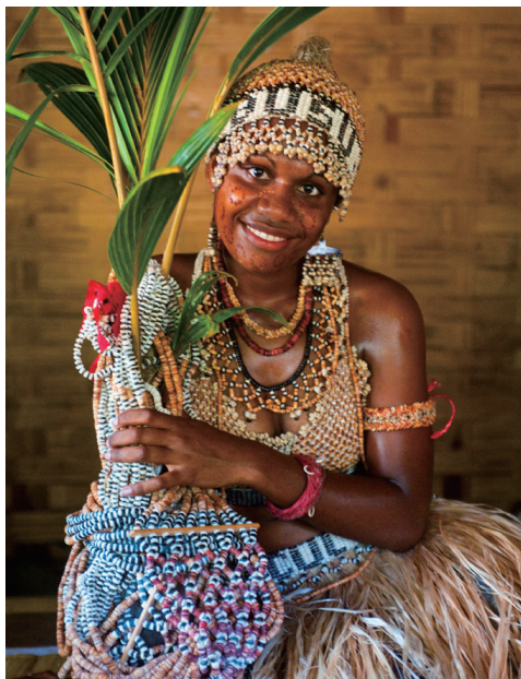
盛装的所罗门群岛土著妇女