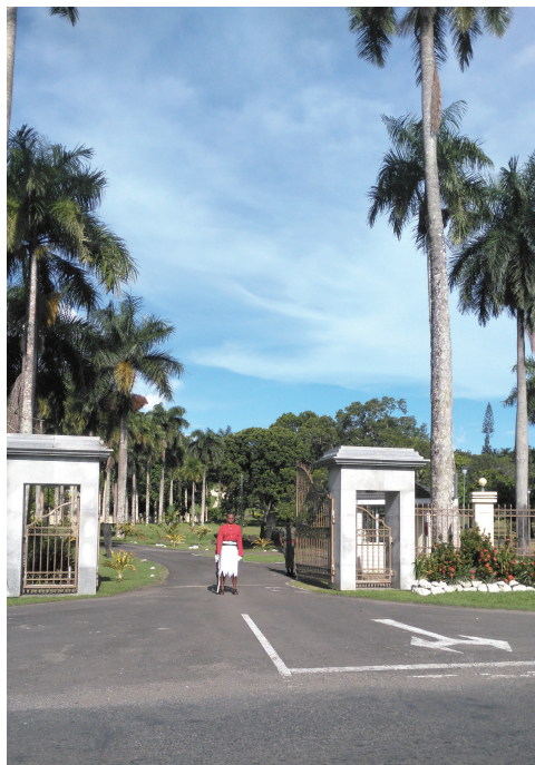
总统府门前的卫兵