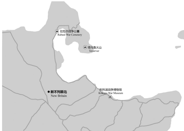
图 3-2 拉包尔主要景点分布示意

个火山口，也是拉包尔火山最活跃的一部分。该火山口不时冒出浓烟，十分具有震撼力。火山下是温泉，当地人经常用温泉水煮蛋。而在塔乌鲁火山的热沙之中，藏有一种拉包尔独特的鸟类——冢雉，这是一种几百万年前的物种，也是和恐龙最接近的生物。冢雉的蛋只有蛋黄，在许多美食家眼中是不可多得的美食。