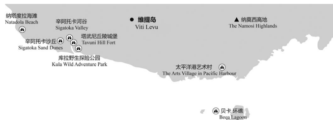
图 1-2 珊瑚海岸与太平洋港主要景点分布示意