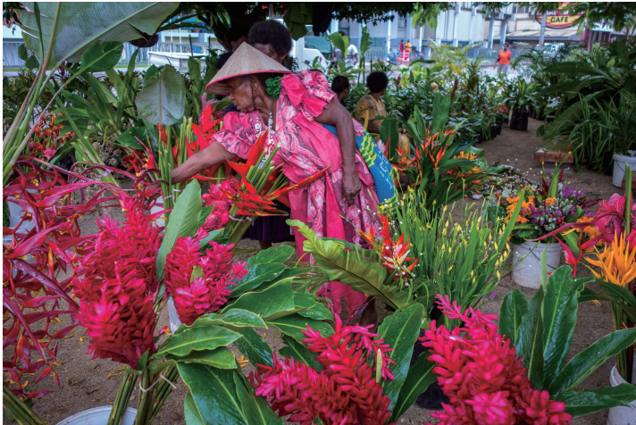
花卉种植园