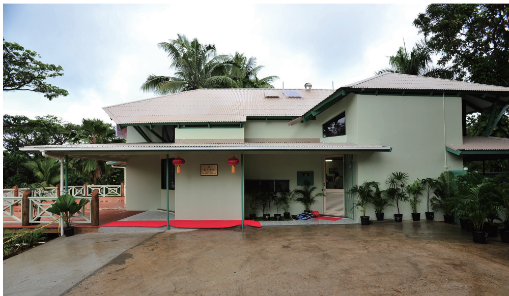
南太平洋大学孔子学院办公楼