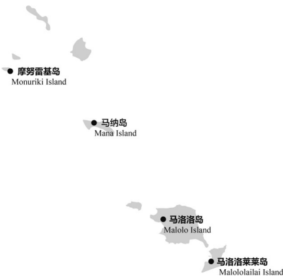
图 1-5 马马努萨群岛主要景点分布示意