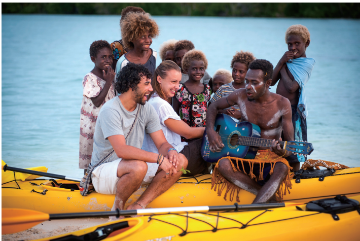
与土著居民共享音乐时光