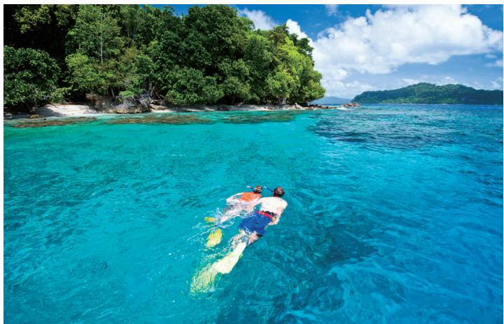
潜水天堂