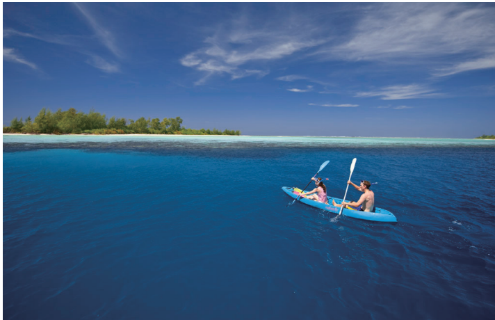
皮划艇巡游