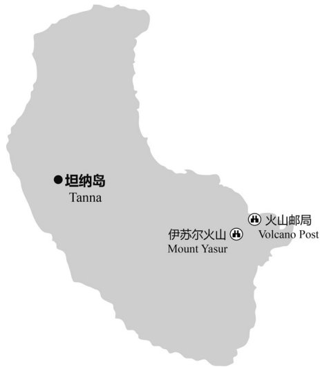
图 5-3 坦纳岛主要景点分布示意

火山，是坦纳岛最著名的旅游景点。伊苏尔火山由印度—澳大利亚板块与太平洋板块相互挤压而成，已经连续喷发了数个世纪，一小时之内甚至可以喷发数次。伊苏尔火山喷出的岩浆多是直起直落，很少斜喷到口外，一般不会伤及游人。伊苏尔火山虽然是一座可以亲近的活火山，但它依然充满了未知和变数。伊苏尔火山的预警级别共分为 6 级，其中，0 级为正常活动状态，1 级为出现扰动状态，2 级为重要扰动状态，3 级为小规模爆发，4 级为中等规模爆发，5 级为大规模爆发。2016 年 8 月 3 日，瓦努阿图气象和地质灾害局发布伊苏尔火山 2 级预警警告，提醒游客在观赏火山时要远离火山口和边缘地带。因此，游客在前往时要密切关注火山动向，做好相应防范，确保生命安全。 ①