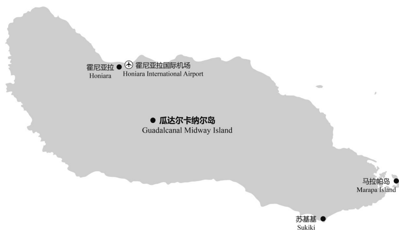
图 2-4 瓜达尔卡纳尔岛主要景点分布示意

陵，榕树、橄榄树、印度马来硬木等多个种类的树木并存，带给人不同的审美享受；海拔最低的地方是沿海的平原，这里有露兜树、椰子树、葡萄树等不同种类的树木，还有红树林沼泽和西谷椰子沼泽。马莱塔岛丰富的植被资源还为鸟类提供了适宜的生存条件，美冠鸚鵡、猫头鹰以及带有当地特色的马莱塔岛扇尾鸟等不同品种的鸟类在此聚集，构成了马莱塔岛数量繁多、品种多样的“鸟的天堂”。除种类繁多的鸟类外，岛上还有蝙蝠、斑袋貂以及其他啮齿动物等哺乳动物，但种类少，且数量不多。马莱塔岛也是所罗门群岛良好的潜水点，相比其他岛屿，这里最大的特点是海水平静温和，游客们可以在此游泳、浮潜，观赏千姿百态的海洋生物，还可以进行水底的探险活动。岛屿西北部的城市奥基（Auki）是马莱塔岛的主要港口，也是岛上最主要的居民点，还是该岛屿的行政中心，这里有海港可供大小船只通行，还有飞机场与其他岛屿通航，为游客出入马莱塔岛提供了便利的交通条件，是马莱塔岛与外界交流的重要窗口。景点分布见图 2-5。