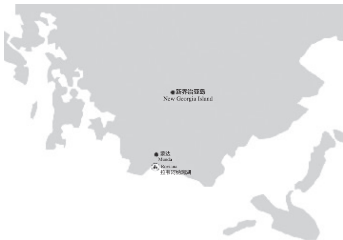
图2-2 蒙达主要景点分布示意