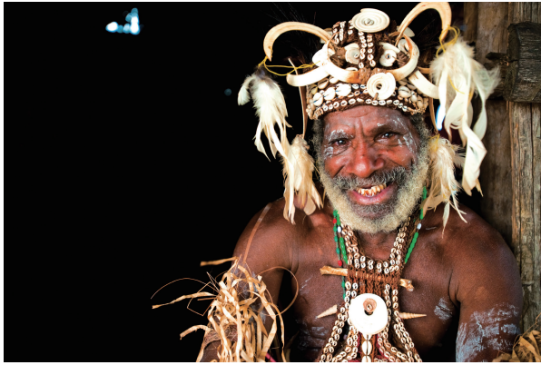
佩戴传统饰品的巴布亚新几内亚人