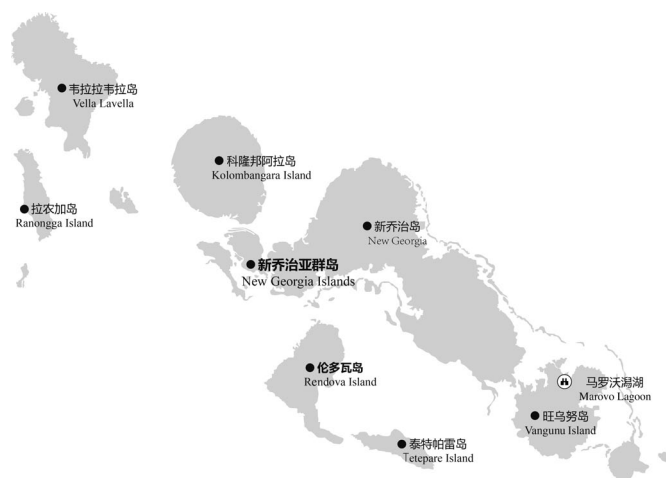
图 2-6 新乔治亚群岛主要景点分布示意

磁铁的海扇，吸附了包括蝠鲼和鲨鱼等在内的许多远洋大鱼和微生物。南马罗沃潟湖是潜水爱好者的胜地，在这里，潜水爱好者们在亲身体验潜水之乐的同时，还可以看到不远处秀丽的风光。而北马罗沃潟湖不仅是钓鱼爱好者的天堂，还是绝佳的风景观赏区。景点分布见图 2-6。