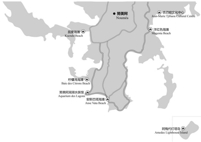
图 4-1 努美阿主要景点分布示意