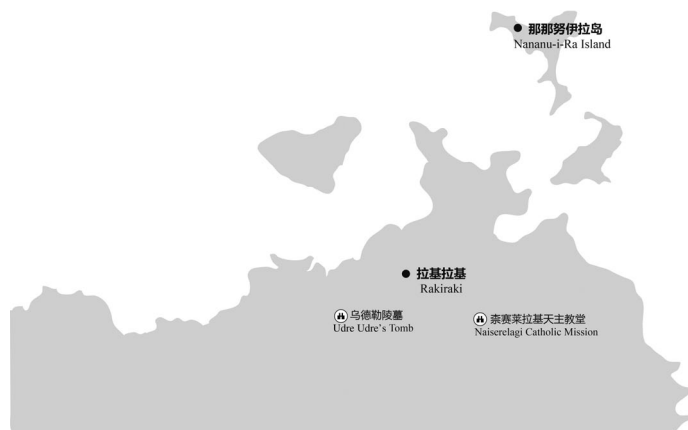
图1-4 拉基拉基主要景点分布示意