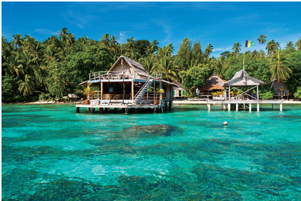
水上度假村