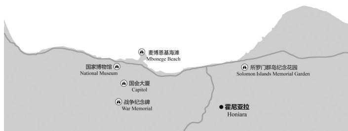
图 2-1 霍尼亚拉主要景点分布示意