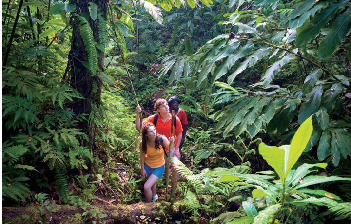
热带雨林漫游