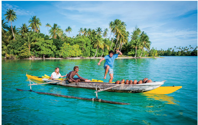
特色独木舟体验