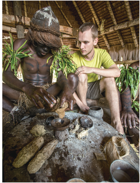
制作卡瓦