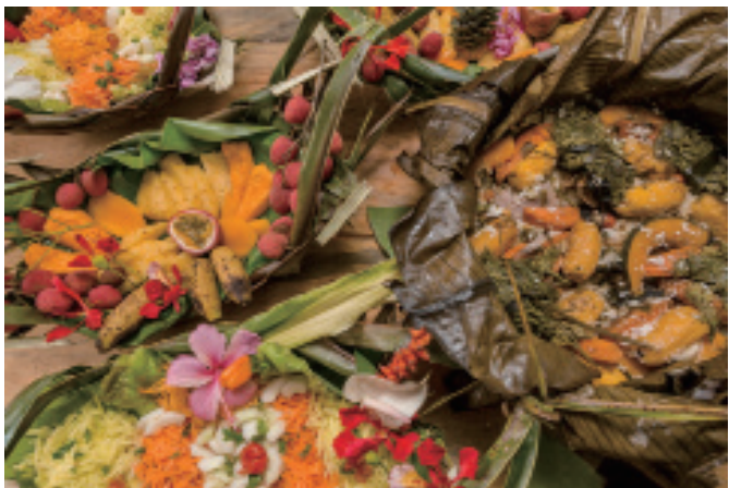
传统美食