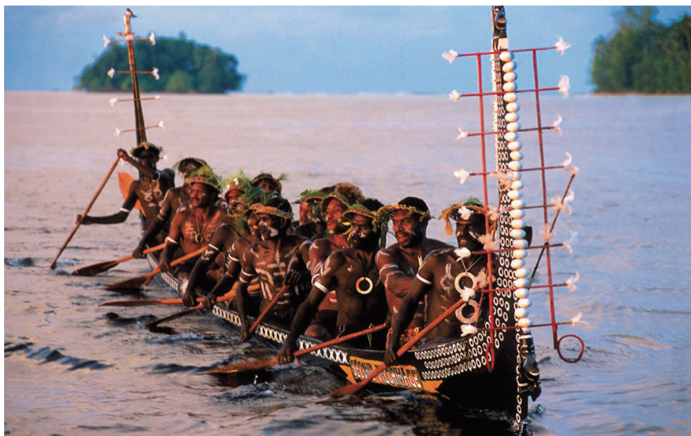
土著男性划独木舟