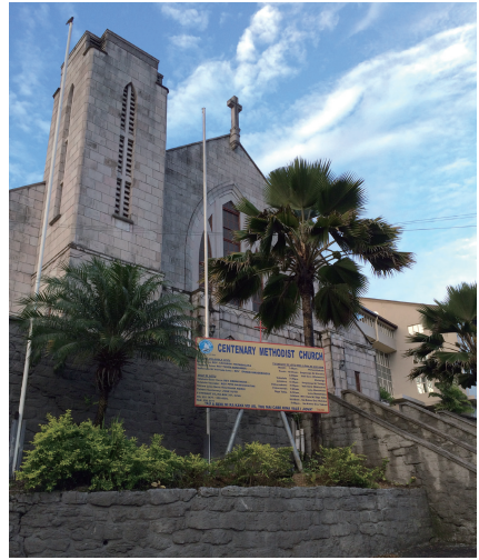
苏瓦市教堂