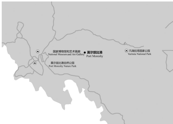
图3-1 莫尔兹比港主要景点分布示意