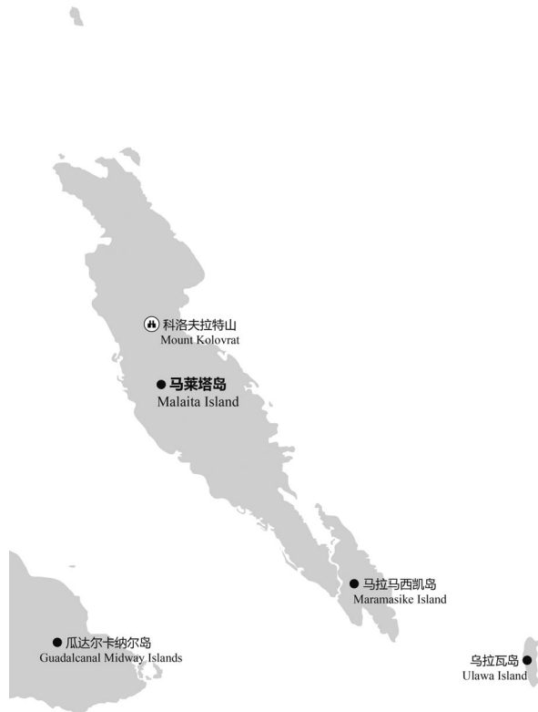
图 2-5 马莱塔岛主要景点分布示意