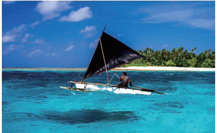
帆船巡游