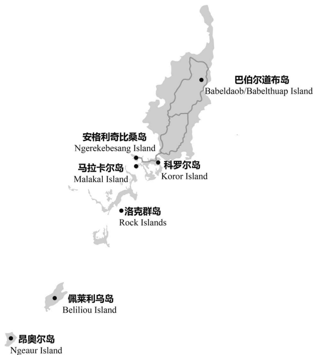
图 1-1 帕劳主要岛屿分布

帕劳国土面积 458 平方公里，海岸线长 1519 公里，海洋专属经济区为 62.16 万平方公里。截至 2015 年，帕劳人口为 2.1 万人。 ① 帕劳全境有 340 多座岛，其中 8 座有人长期居住。岛屿按地质分为两种不同的类型，北方多为火山岛，南方多是珊瑚礁岛。巴伯尔道布岛是帕劳面积最大的岛屿，占地 332 平方公里，多山地，帕劳最高峰——海拔 242 米的恩切尔奇斯山（Mount Ngerchelchuus）即位于该岛。帕劳属于热带雨林气候，年平均气温 27℃ 左右，年平均降雨量 3800 毫米。帕劳位于赤道附近，地转偏向力较小，极少受到热带气旋影响。帕劳主要岛屿分布见图 1-1。