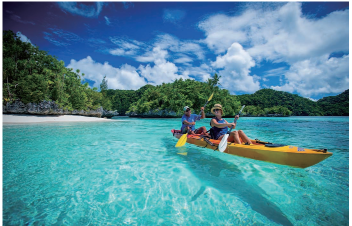
皮划艇巡游