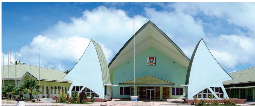
国会大楼