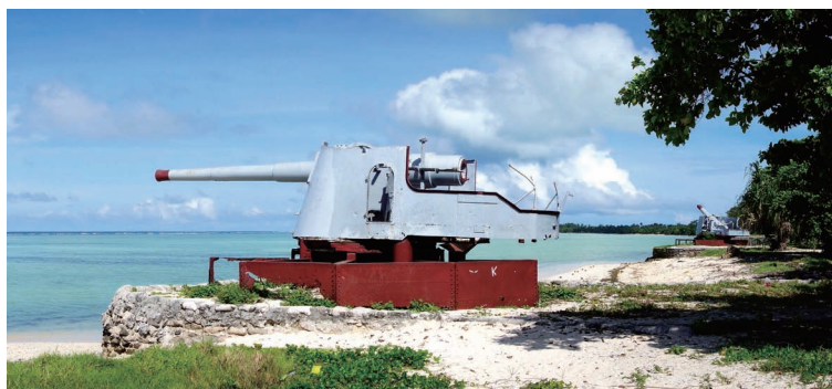
二战时期的炮台