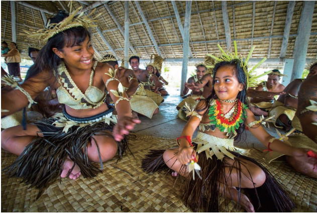
传统舞蹈