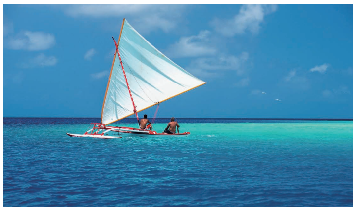
帆船巡游