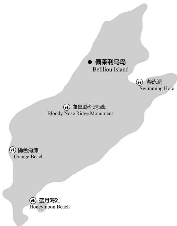
图 1-6 佩莱利乌岛主要景点分布