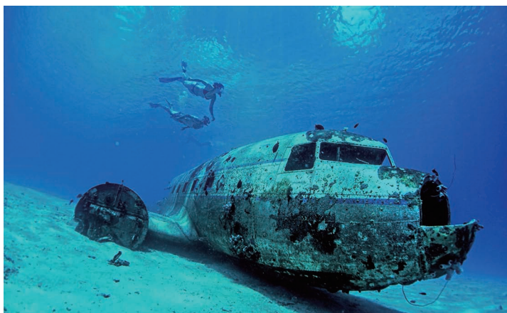
深海遗迹潜水