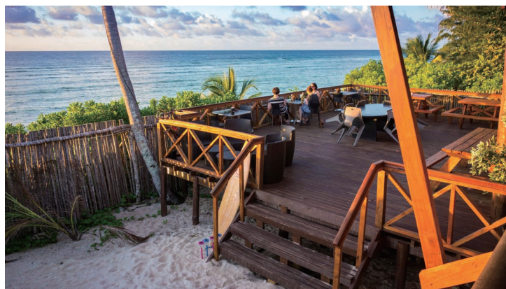
露天餐厅