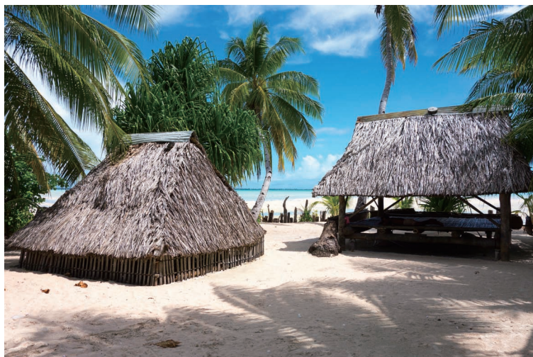
传统文化村