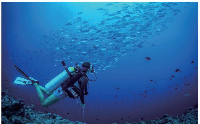
深海潜水