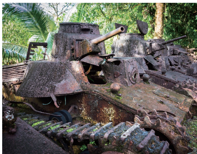
第二次世界大战时期的坦克