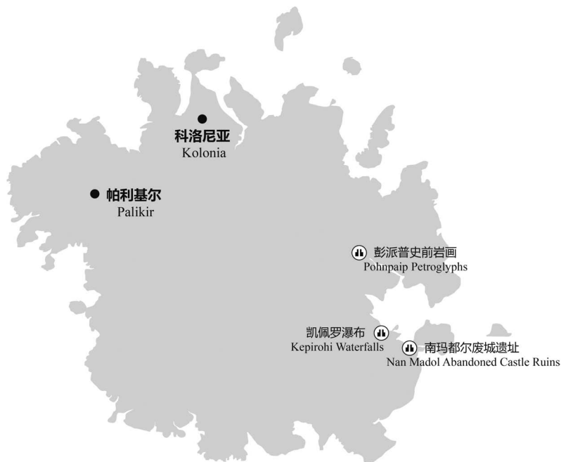
图3-3 波纳佩岛主要景点分布