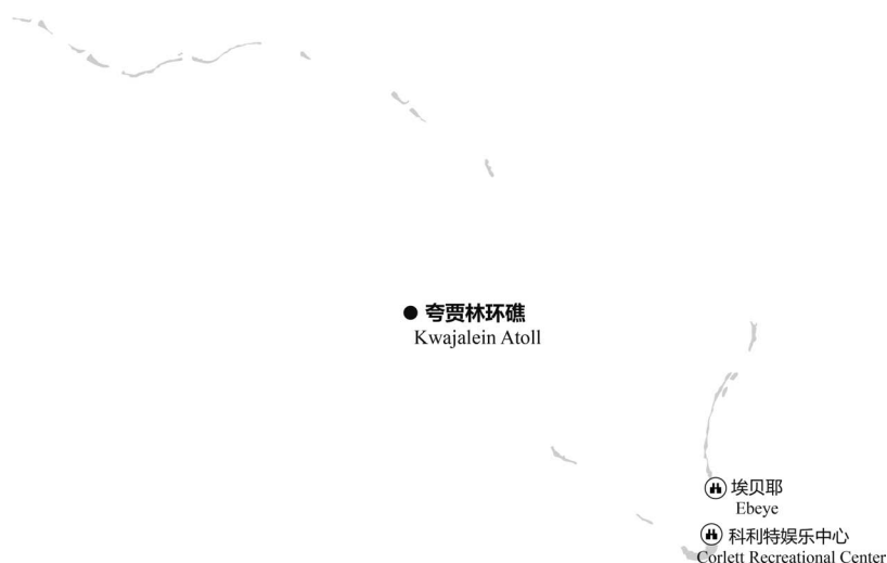
图 4-2 夸贾林环礁主要景点分布