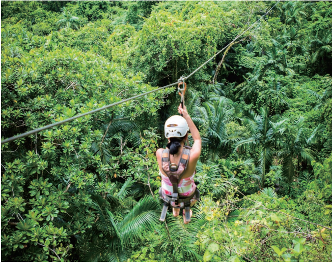
高空滑索