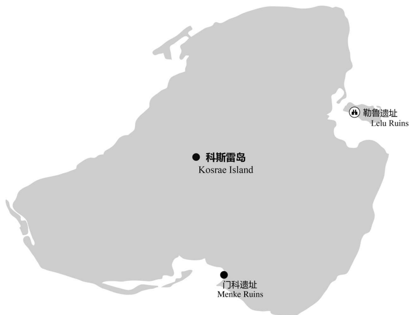
图 3-4 科斯雷岛主要景点分布

珊瑚金字塔。最早的欧洲发现者来到这里约是在 1824 年，当时岛上有 3000 ~ 6000 人，他们分为四个不同的社会阶层。勒鲁遗址包括 100 多个围墙大院，大部分位于居住区，那些高大的、比较华丽的石墙为当时的统治者所拥有，围墙里面还有一些房屋。这些围墙代表了当时社会的发展历史和人们的生活水平，是重要的历史见证。