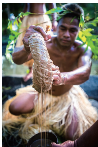
当地人身着传统服饰制作萨考酒