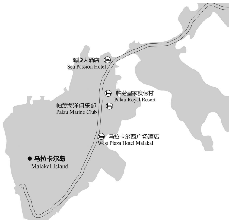
图 1-7 马拉卡尔岛主要酒店分布