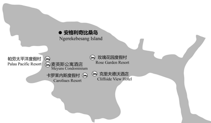
图 1-5 安格利奇比桑岛主要酒店分布