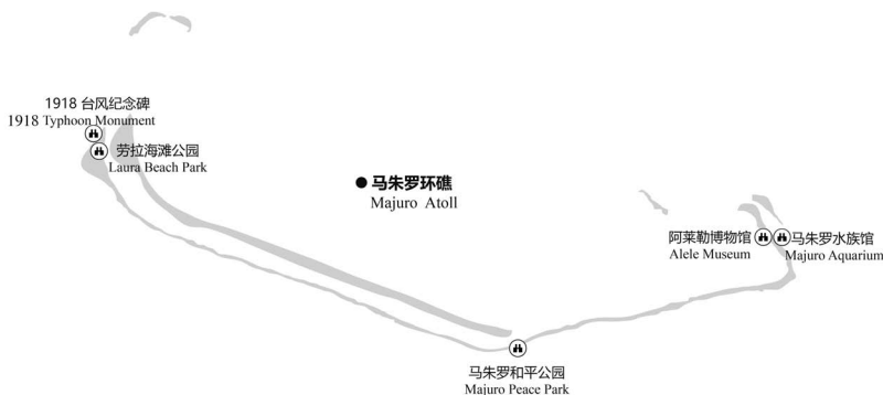
图 4-1 马朱罗环礁主要景点分布