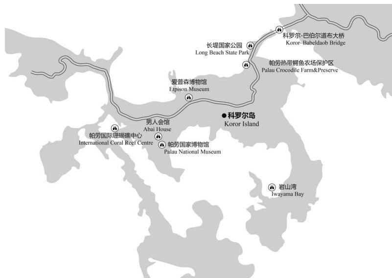
图 1-2 科罗尔岛主要景点分布

部、艺术与文化部和图书馆部。自然历史部是博物馆新成立的一个部门，管理着帕劳自然历史的重要档案；媒体集部拥有总数超过 25000 张照片，这些照片的内容包含历史事件、乡村生活、传统习俗等，是记录帕劳社会发展的重要载体；艺术与文化部收藏有 4500 件展品，内容涉及人类学、艺术、历史等多个学科，这些收藏品大多来自密克罗尼西亚；图书馆部收藏有超过 5000 册的书籍，其中不乏一些罕见的原始书籍，这些书籍不流通，但是允许游客在开放时间参观研究。