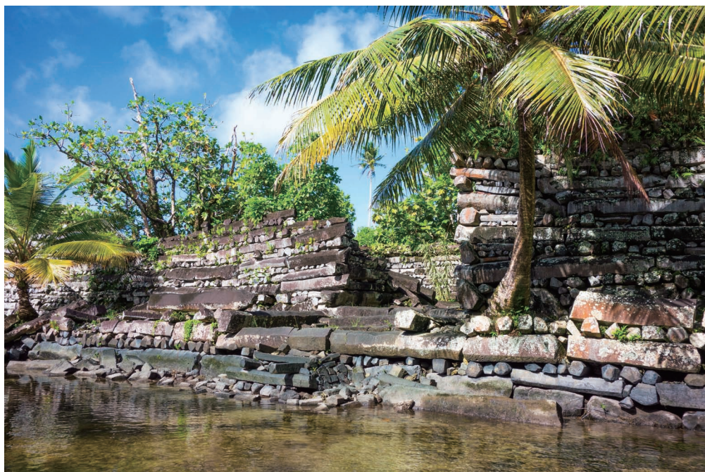
南玛都尔古城