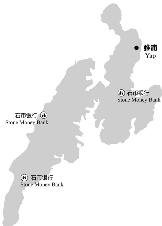
图 3-1 雅浦岛主要景点分布