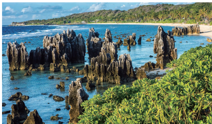
被海水侵蚀的奇 形怪状的岩石