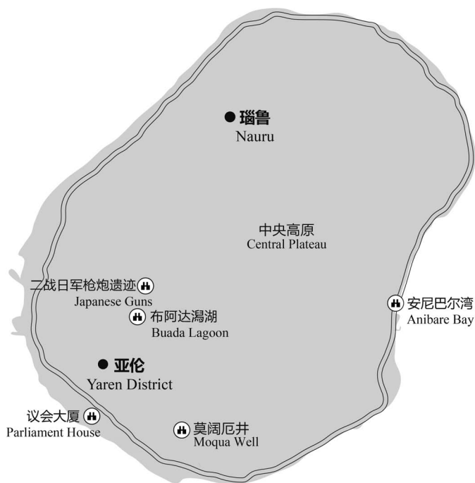
图 5-1 瑙鲁主要景点分布