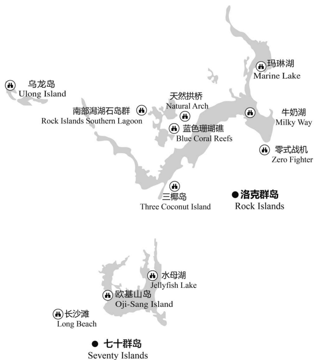
图 1-4 洛克群岛主要景点分布

在没有天敌的进化过程中，它们渐渐失去了毒性及防御能力，成为世界上独一无二的无毒水母。无毒水母主要靠海藻分泌的营养素维生，它们会在接近中午的时候浮到水面进行光合作用。