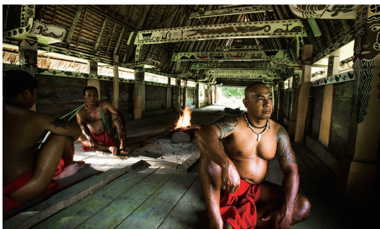
男人会馆