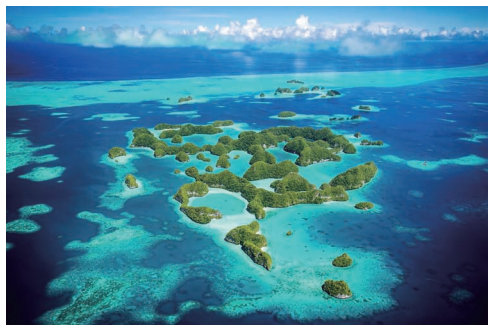
七十群岛