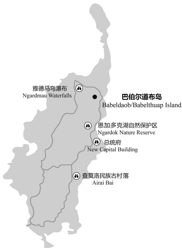
图 1-3 巴伯尔道布岛主要景点分布