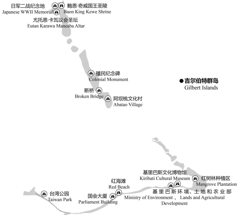
图 2-1 吉尔伯特群岛主要景点分布