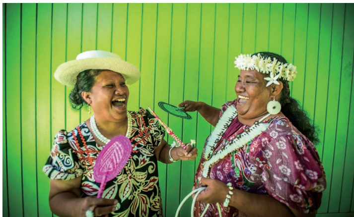
盛装的当地妇女